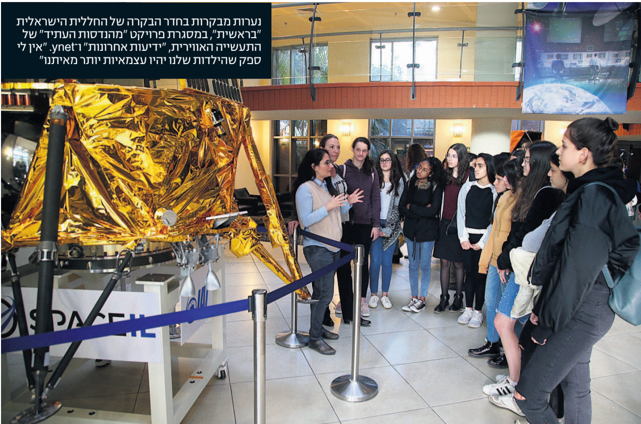
נערות מבקרות בחדר הבקרה של החללית הישראלית "בראשית", במסגרת פרויקט "מהנדסות העתיד" של התעשייה האווירית, "ידיעות אחרונות" ו-y.net. אין לי ספק שהילדות שלנו יהיו עצמאיות יותר מאיתנו"